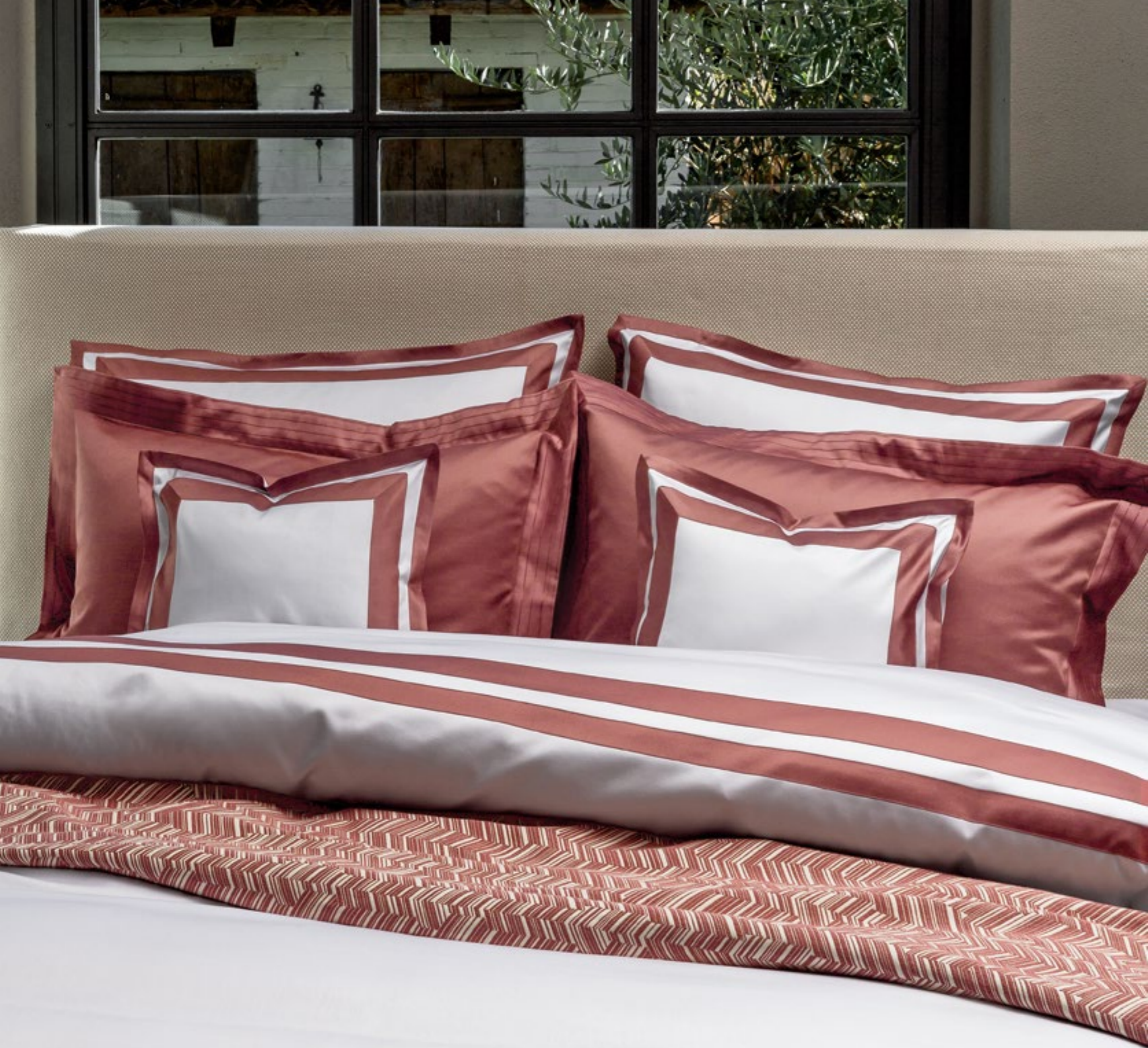
COMPLETO LETTO GARDA/SHINE SHEET SET GARDA/SHINE