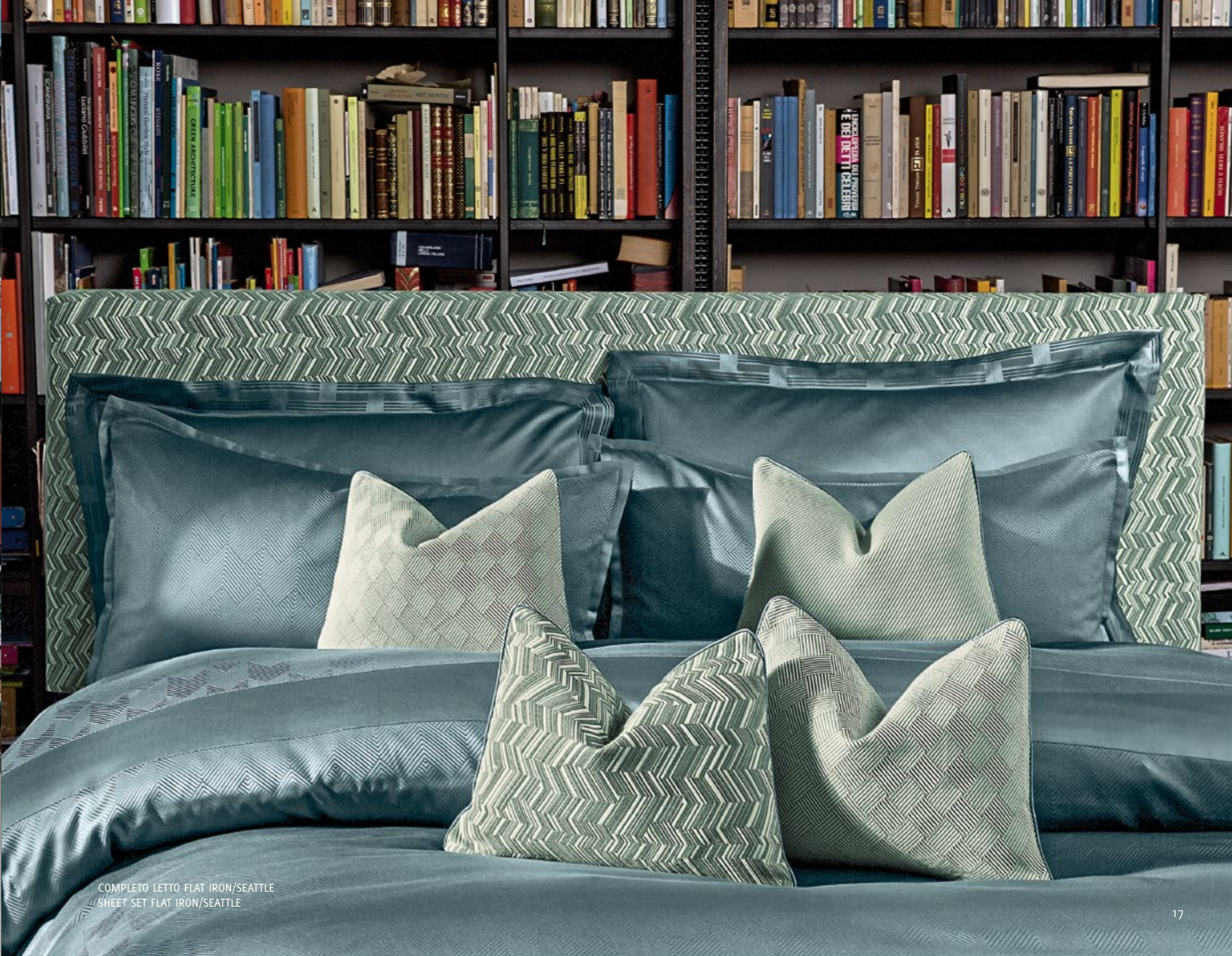
COMPLETO LETTO FLAT IRON/SEATTLE SHEET SET FLAT IRON/SEATTLE