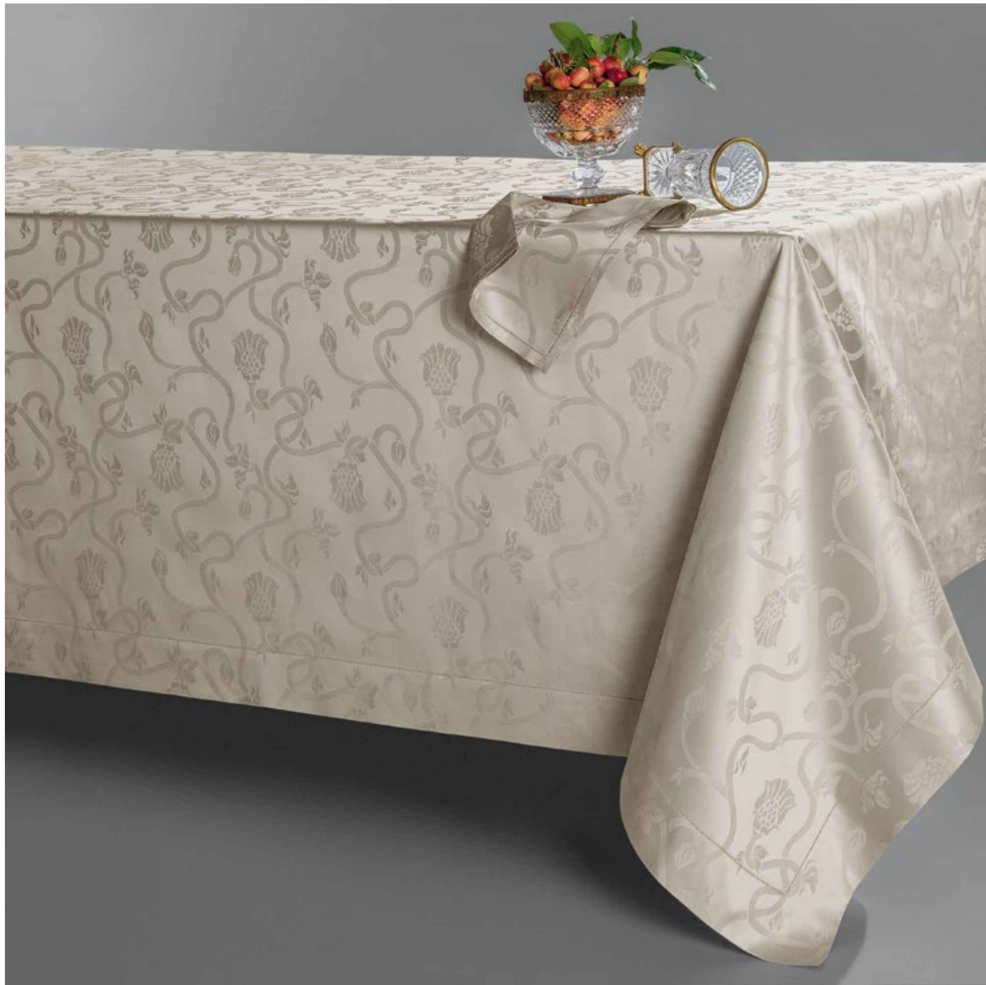
TOVAGLIA LIBERTY TABLECLOTH LIBERTY