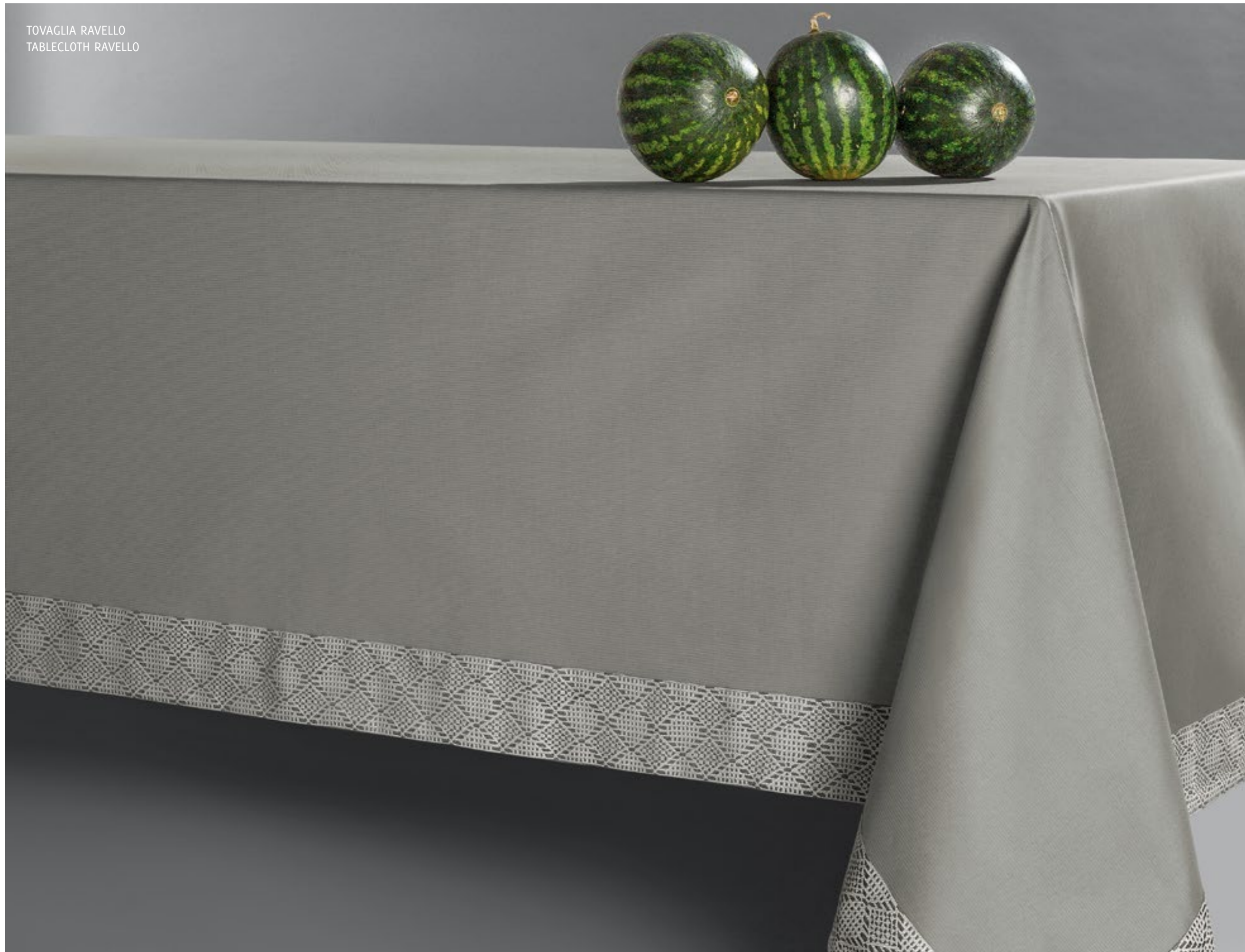
TOVAGLIA RAVELLO TABLECLOTH RAVELLO