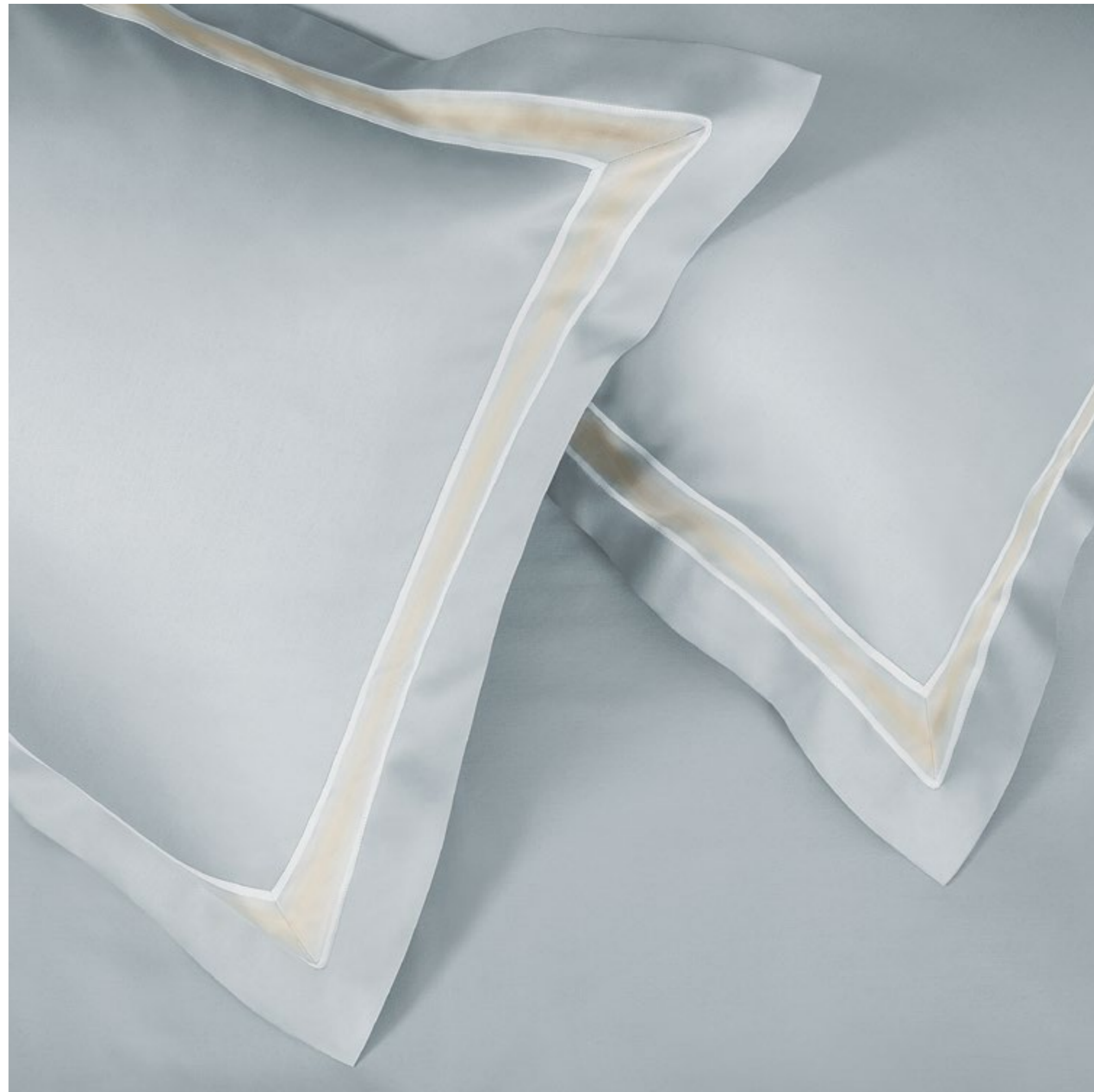
COMPLETO LETTO KENSINGTON SHEET SET KENSINGTON