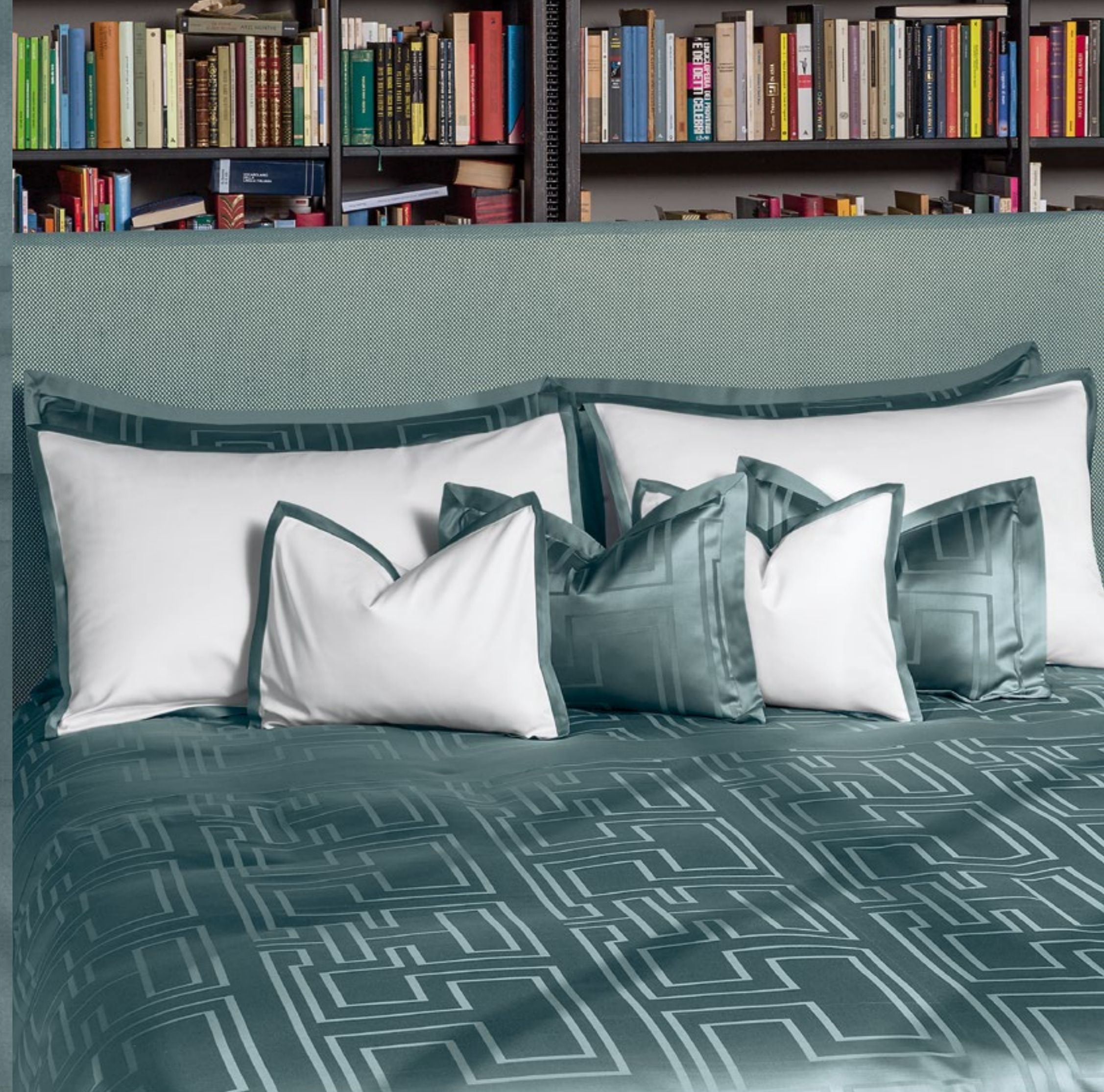
FROM LEFT COMPLETO LETTO ARIANNA SHEET SET ARIANNA