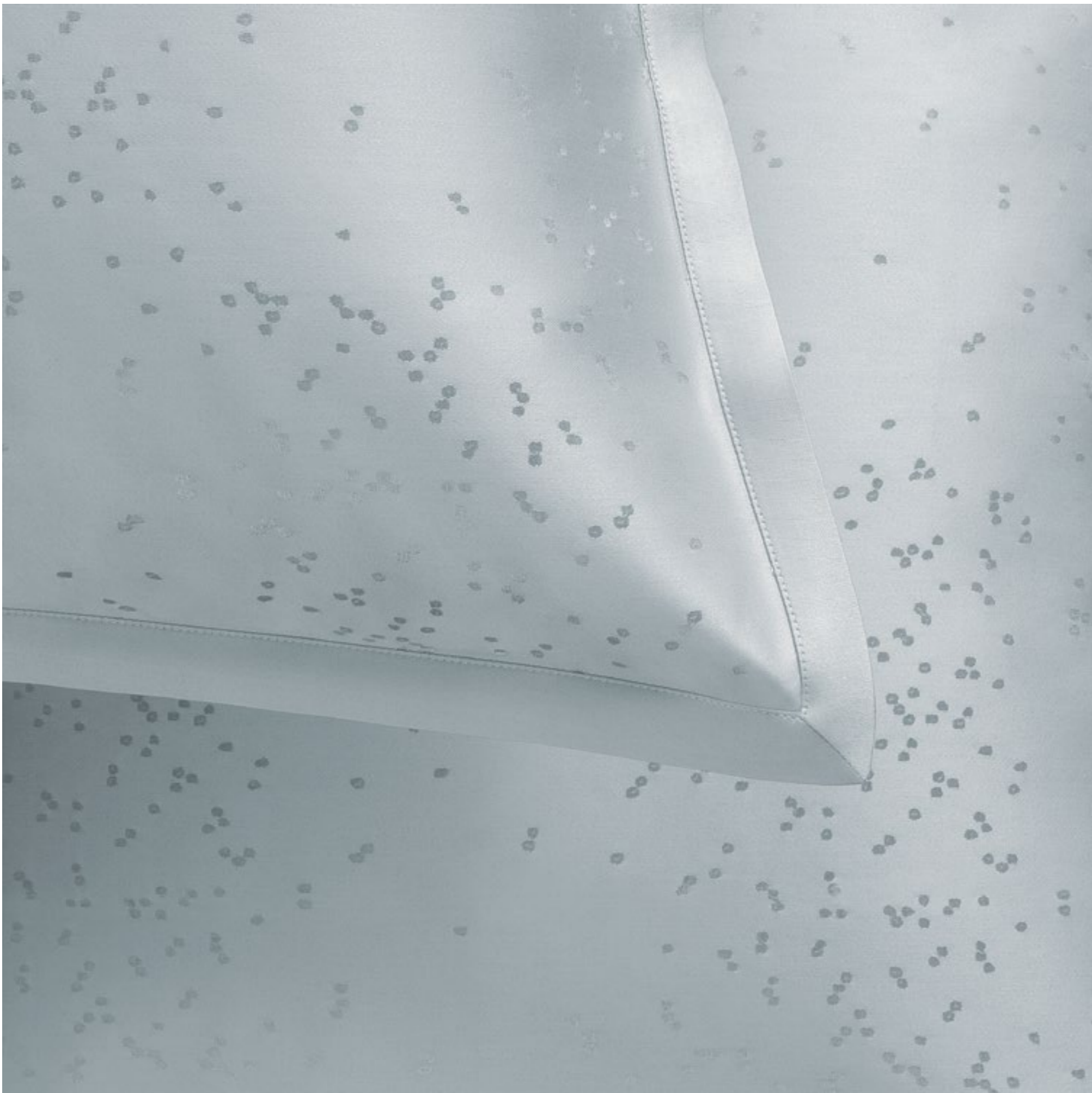
COMPLETO LETTO GRAINS SHEET SET GRAINS