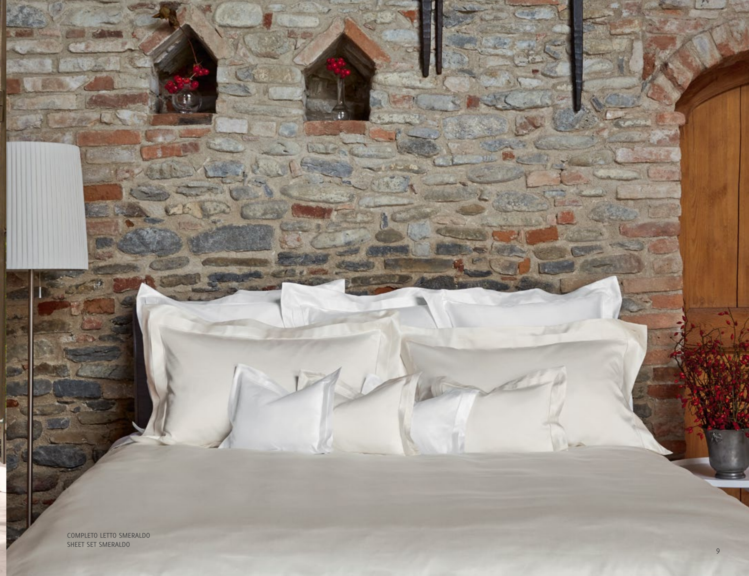
COMPLETO LETTO SMERALDO SHEET SET SMERALDO