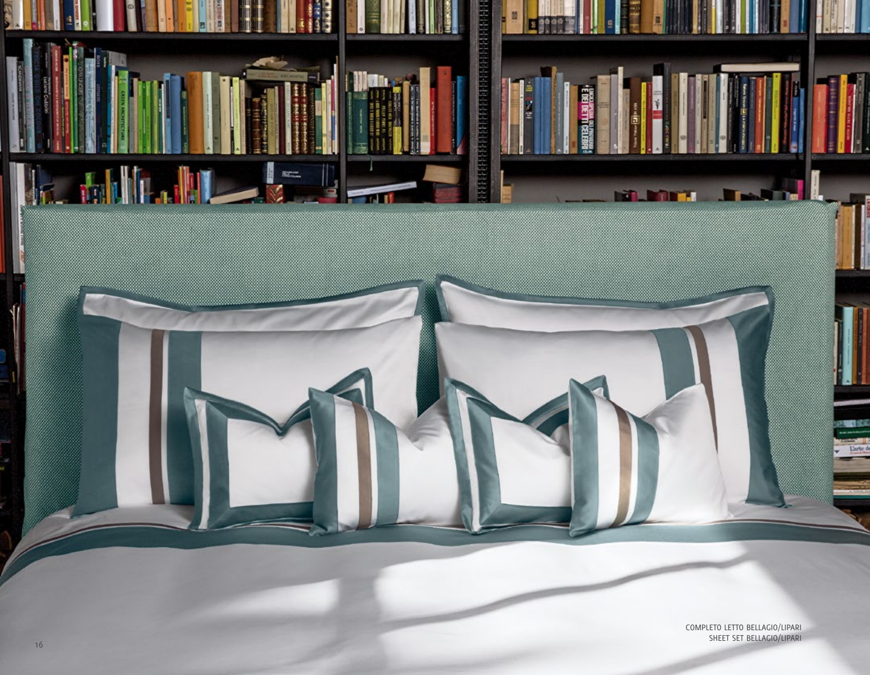
COMPLETO LETTO BELLAGIO/LIPARI SHEET SET BELLAGIO/LIPARI