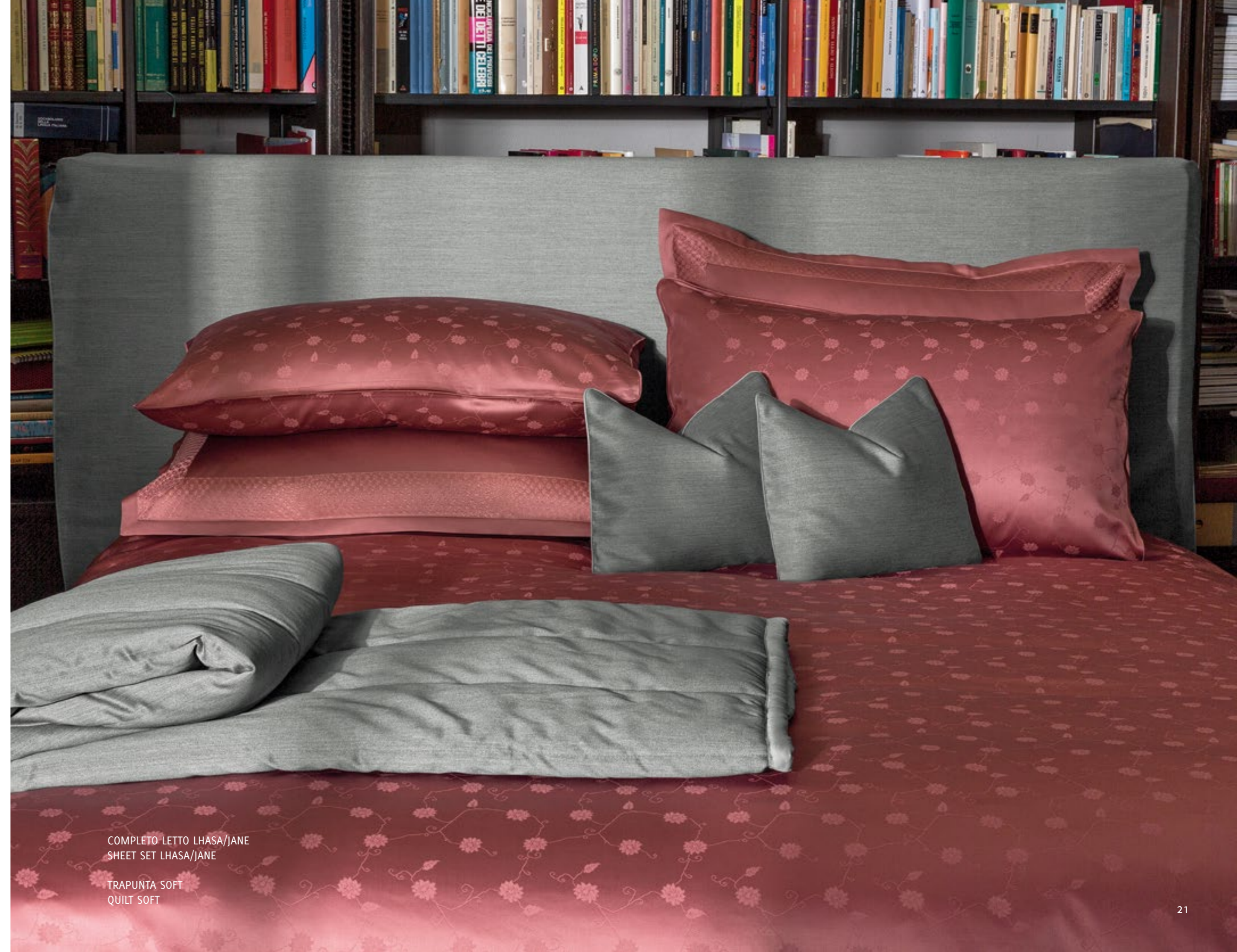
COMPLETO LETTO LHASA/JANE SHEET SET LHASA/JANE