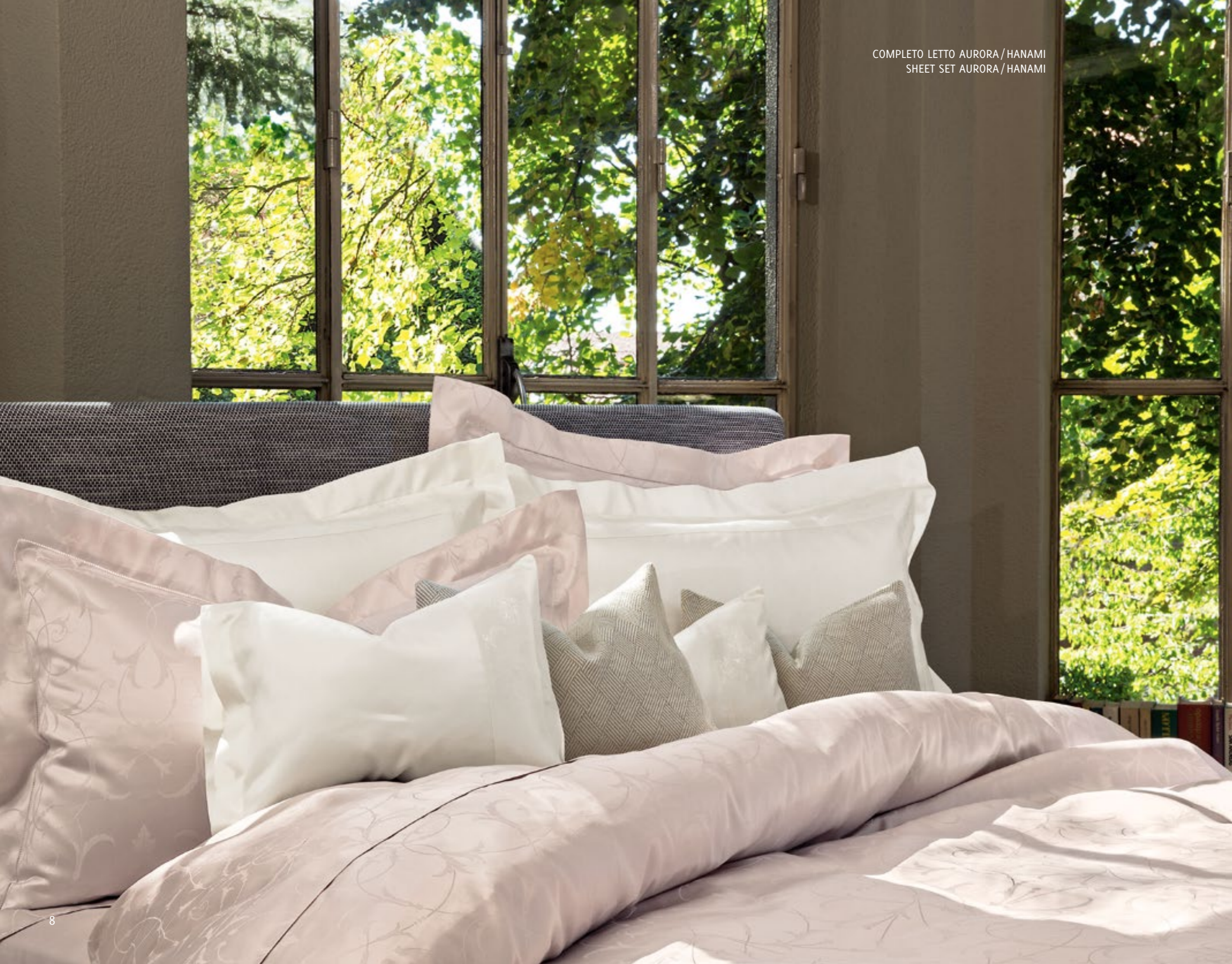
COMPLETO LETTO AURORA / HANAMI SHEET SET AURORA / HANAMI