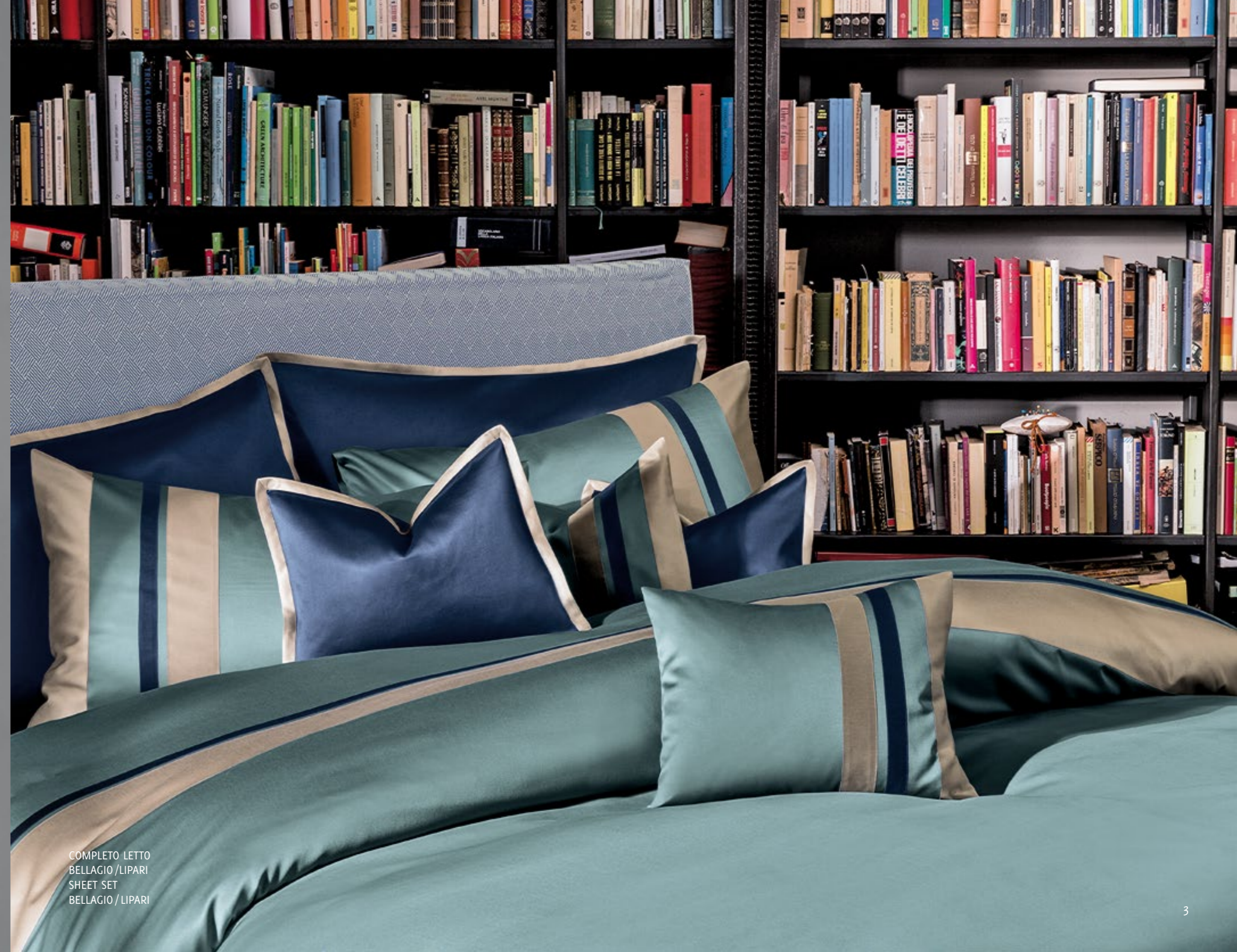
COMPLETO LETTO BELLAGIO /LIPARI SHEET SET BELLAGIO /LIPARI