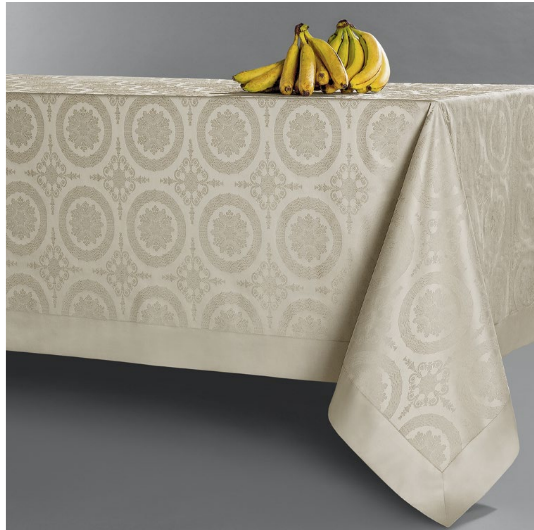
TOVAGLIA IMPERO TABLECLOTH IMPERO